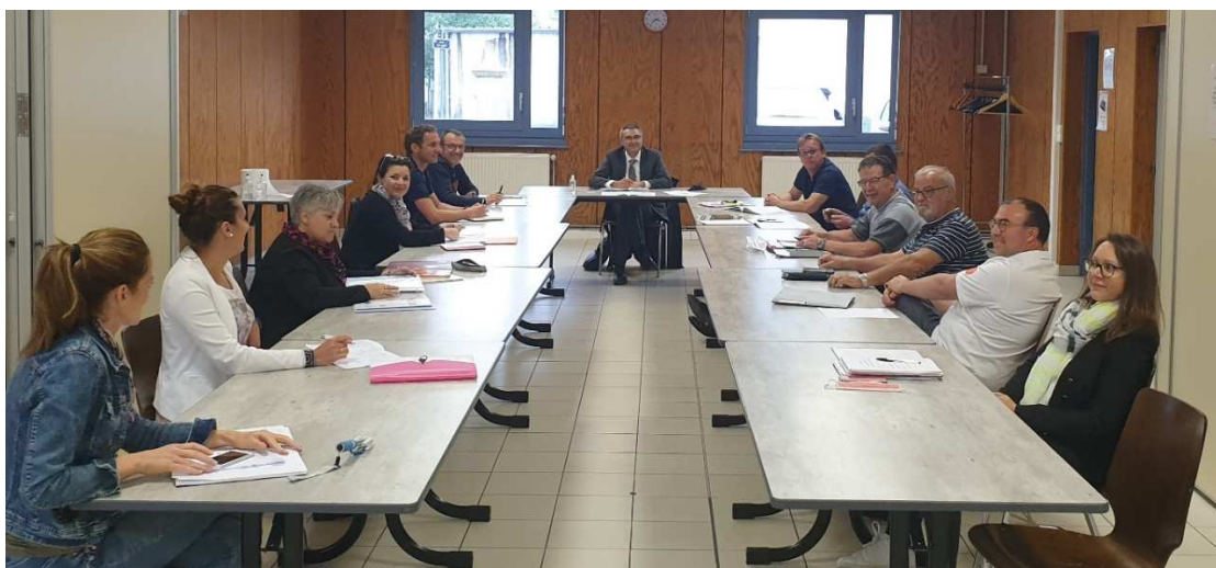
Elus en réunion d'équipe, salle polyvalente

Suite aux élections municipales du 15 mars 2020, la nouvelle équipe n'a été mise en place que le 25 mai en raison de la période de confinement.