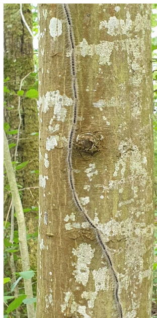
Procession de chenilles à la Voivre - 14/06/20