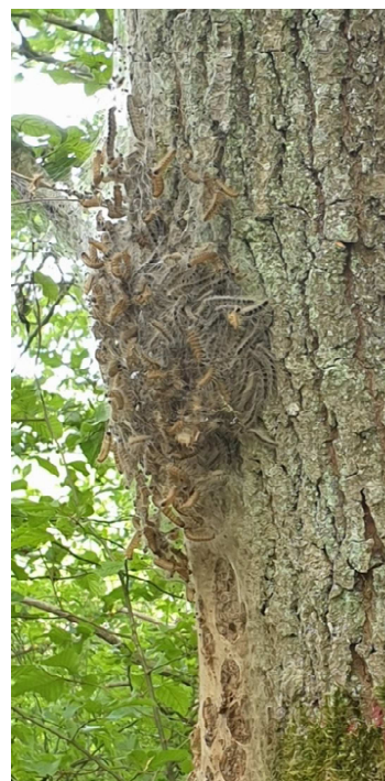
Voivre - 14/06/20

La présence de chenilles urticantes dans le village nous a été signalée. Nous avons pu aussi remarquer des chenilles processionnaires urticantes en forêt. Ces dernières se trouvent principalement sur les chênes. Des symptômes ont été observés tels que des démangeaisons ou éruptions cutanées, principalement sur les zones découvertes du corps ou encore conjonctivites. Une solution de traitement des lieux particulièrement infectés est à l'étude.